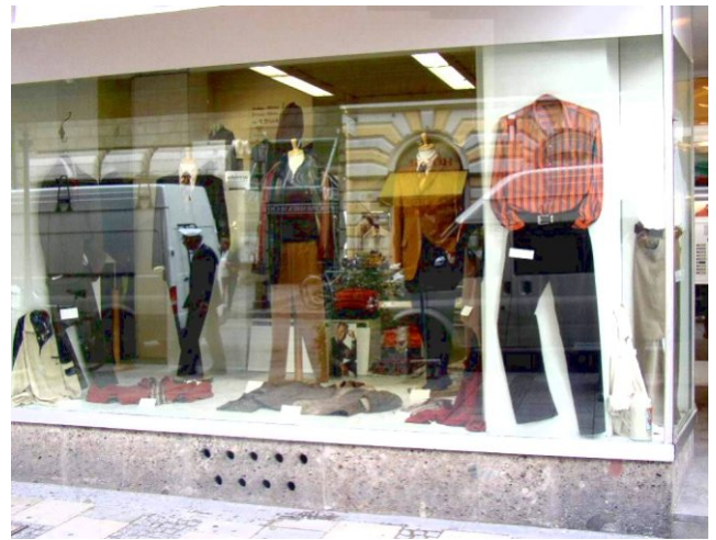
Schaufenster - UV-Schutz