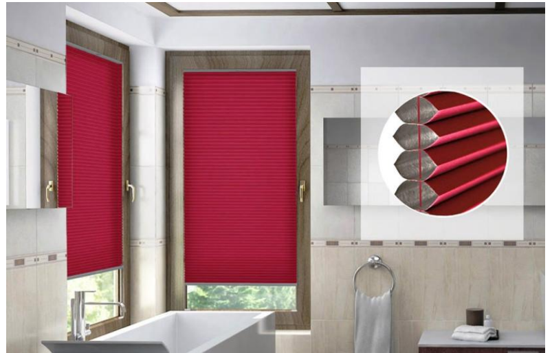
keine sichtbaren Stanzlöcher und Schnüre