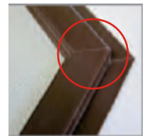
Gehrungsecken (optional gegen Aufpreis)

Standardfarben hochwertige Pulverbeschichtung in -weiß (ähnlich RAL 9003) -braun (ähnlich RAL 8017) -silber (ähnlich RAL 9006) - anthrazit RAL 7016 RAL Farben erhalten Sie optional.