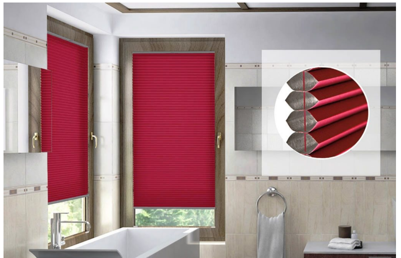
keine sichtbaren Stanzlöcher und Schnüre