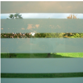
9001 Linea weiße Linien 18mm/ transp. Linien 6mm

Innenverlegung Hochwertige, reißfeste Mattierungsfolie mit guten UV-Schutz und Splitterschutzeigenschaften-kein nennenswerter Lichtverlust