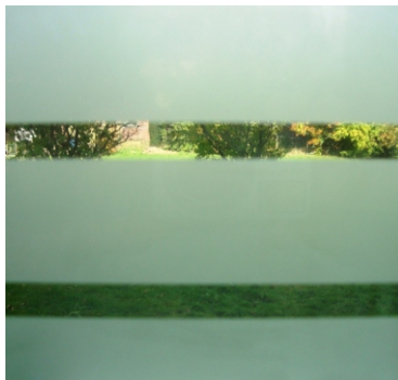
9004 Alpha weiße Linien 35mm/ transp. Linien 5mm