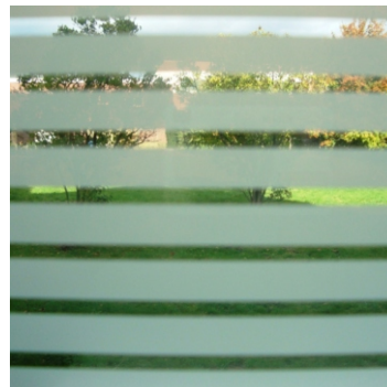
9000 Linea weiße Linien 10mm/ transp. Linien 4mm