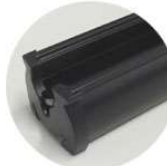
Schwarz-Braun RAL 8022