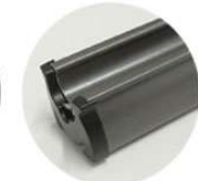
Anthrazit RAL 7016