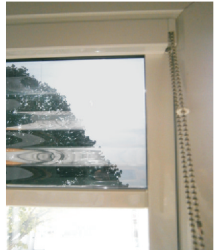
Innenansicht (klarer Durchblick wie durch eine Sonnenbrille)