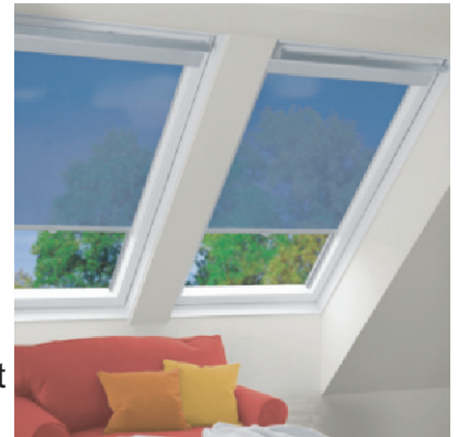
Fragen Sie auch nach unseren Dachfensterrollos

Farben: weiß, silbergrau, RAL auf Anfrage