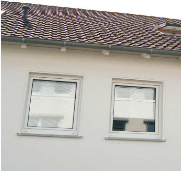
Außenansicht (verspiegelter Sonnen-Sichtschutz)